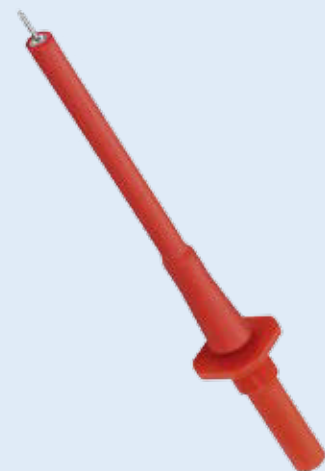
SPS 7097 Ni / ..(Farbe) SPS 7097 Ni / ..(colour)