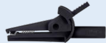
SAK 6715 Ni / 2 / ..(Farbe) SAK 6715 Ni / 2 / ..(colour)